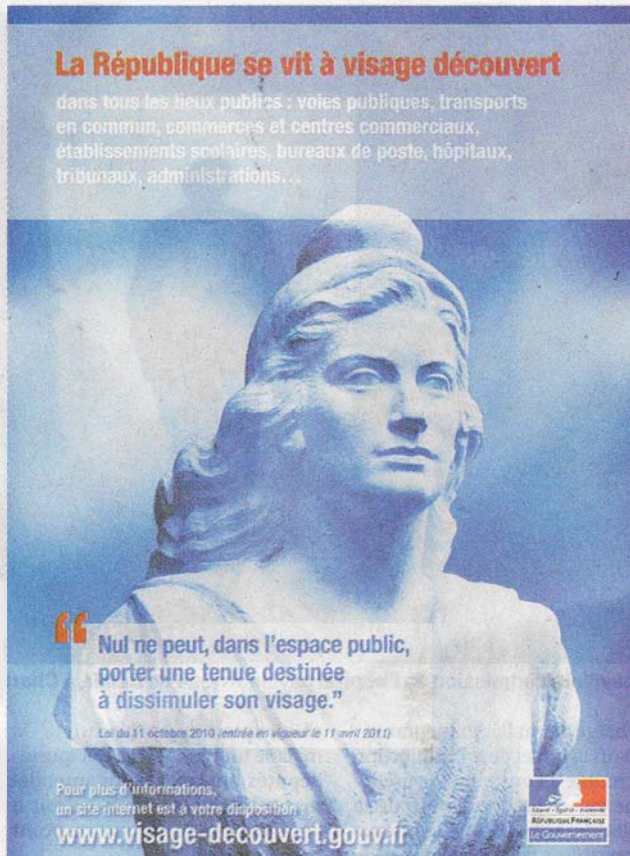
Affiche de la campagne de la loi contre le port du voile intégral.

Alors que l'école est occasionnellement confrontée à ce type de situation, la Haute autorité de lutte contre les discriminations et pour l'égalité (Halde) avait estimé, en 2007, que le fait d'interdire la parti-